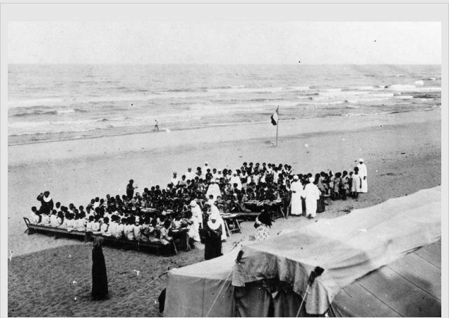
La prima colonia del "Sacro Cuore" a Pesaro